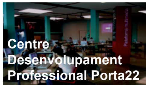
Centre Desenvolupament Professional Porta22