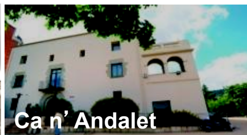
Ca n' Andalet