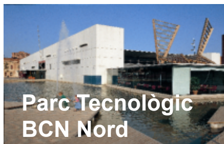
Parc Tecnològic BCN Nord