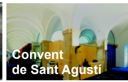
Convent de Sant Agustí