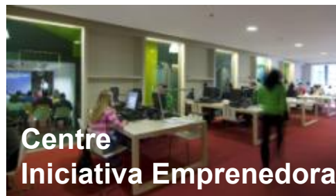
Centre Iniciativa Emprenedora