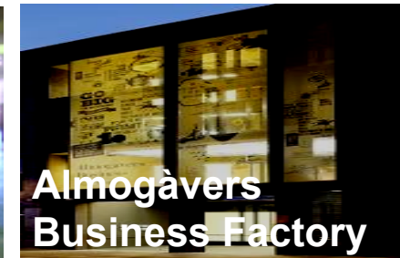
Almogàvers Business Factory